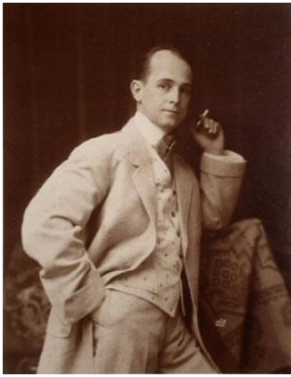
Winsor McCay.